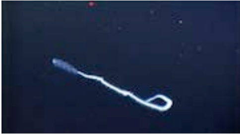
sifonòfor fisonèctid ( Apolemia sp.)