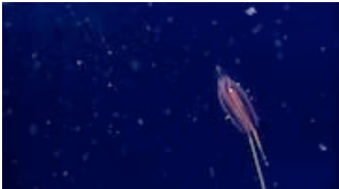
ctenòfor ( Cydippida sp.)