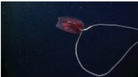
ctenòfor ( Aulacoctenidae sp.)