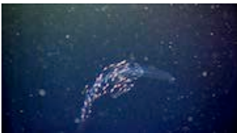
sifonòfor ( Forskalia formosa )