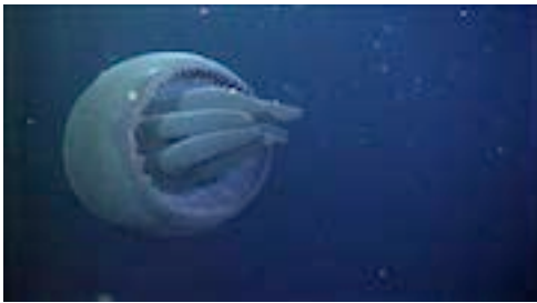
discomedusa ( Tiburonia granrojo )