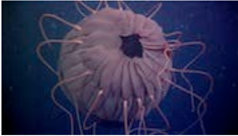
escifomedusa coronada ( Periphyllopsis braueri )