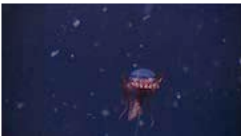
escifomedusa coronada ( Atolla wyvillei )