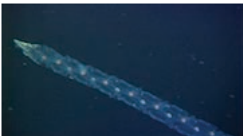
salpa ( Salpa fusiformis )