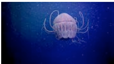
escifomedusa coronada ( Periphyllopsis braueri )