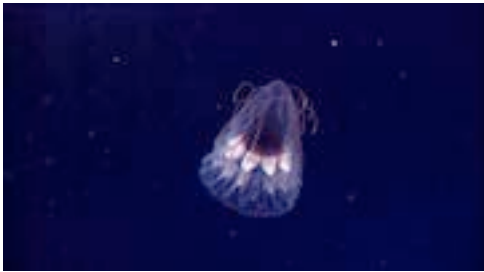
escifomedusa coronada ( Periphylla periphylla )