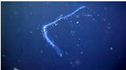
sifonòfor fisonèctid ( Resomia convoluta )