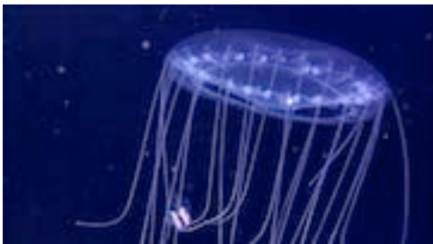
narcomedusa ( Solmissus incisa )