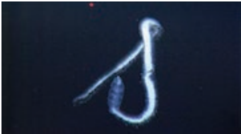
sifonòfor fisonèctid ( Apolemia sp.)