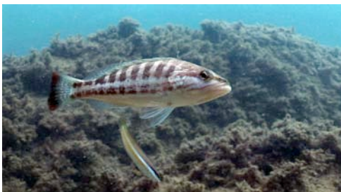
serrà ( Serranus cabrilla )