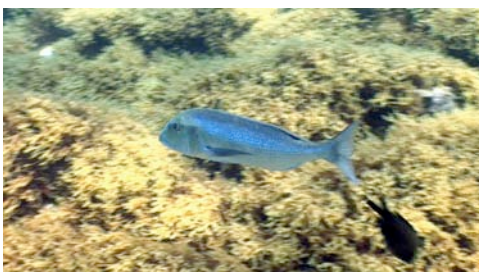
déntol ( Dentex dentex )