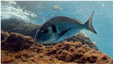
orada ( Sparus aurata )