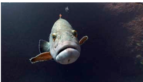
mero ( Epinephelus marginatus )