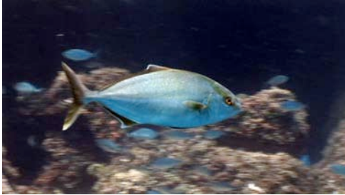
cèrvia o círvia ( Seriola dumerili )