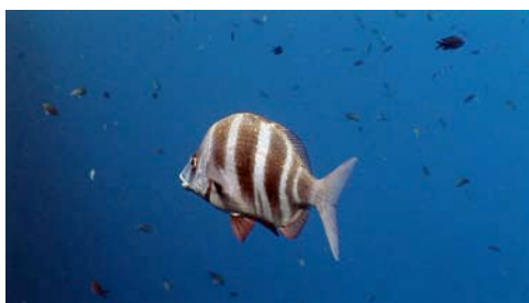
sarg imperial ( Diplodus cervinus )