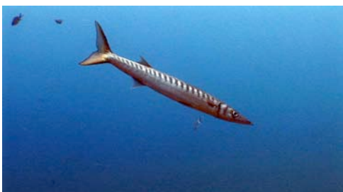
espet ( Sphyrna sphyraena )