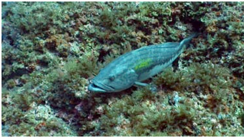
mero ratllat ( Epinephelus alexandrinus )