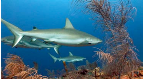
tauró gris d'escull ( Carcharhinus amblyrhynchos )