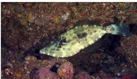
gallo azul ( Aluterus scriptus )