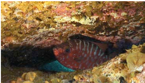
catalufa ( Heteropriacanthus cruentatus )