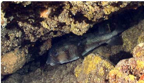
tamboril espinoso ( Chilomycterus atringa )