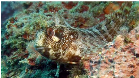
capsigrany ( Parablennius gattorugine )