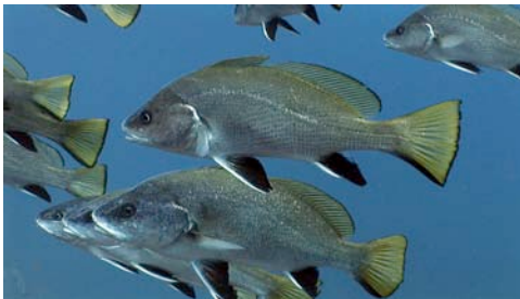
corball de roca ( Sciaena umbra )