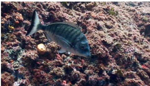
morruda ( Diplodus puntazzo )