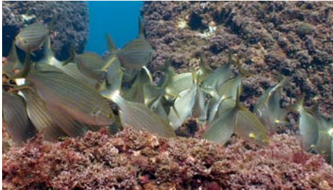
salpa ( Sarpa salpa )