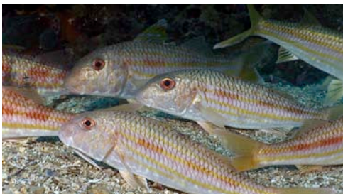
roger de roca ( Mullus surmuletus )