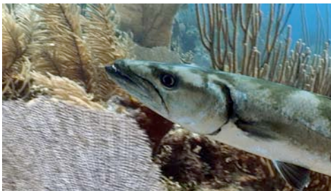
barracuda ( Sphyraena barracuda )