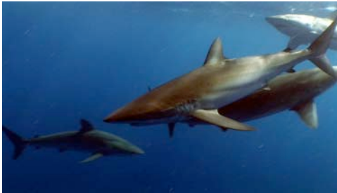
tauró sedós ( Carcharhinus falciformis )

Atenció: no totes les espècies tenen noms comuns; algunes només reben el nom del grup dels organismes al qual pertanyen. D'altra banda, no facilitem el nom científic de totes les espècies perquè sovint, per precisar-lo, a part de la imatge calen més informacions.