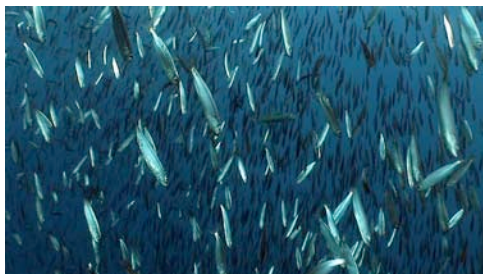
seitó ( Engraulis encrasicolus )