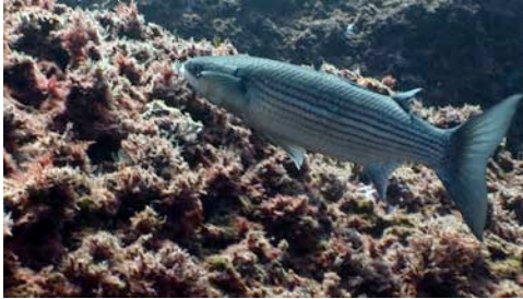
llissa galta-roja ( Liza aurata )