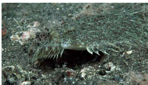
pedaç ( Bothus podas )