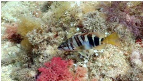
vaca serrana ( Serranus scriba )