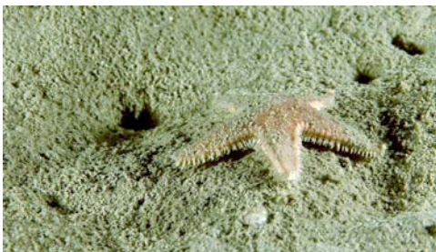
estrella de mar ( Astropecten sp.)