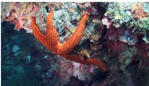
estrella de mar vermella ( Echinaster sepositus )