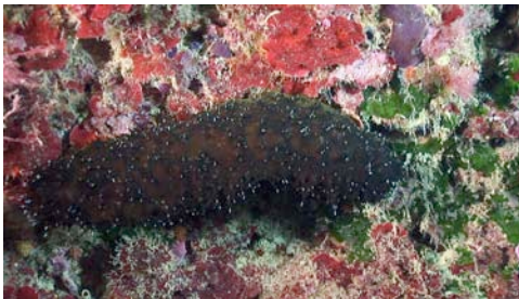
holotúria o cogombre de mar ( Holothuria sp.)