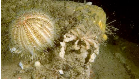
eriçó de fondària ( Echinus sp.) i cranc cobert d'esponges ( Inachus thoracicus )