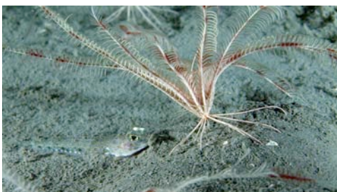
crinoïdeu ( Leptometra phalangium ) i peix