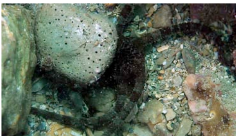
ofiuroïdeu ( Ophioderma longicaudum )