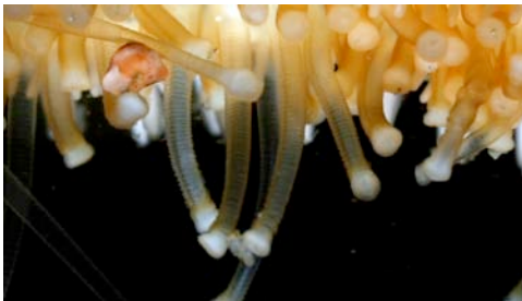
peus ambulacrals d'una estrella de mar