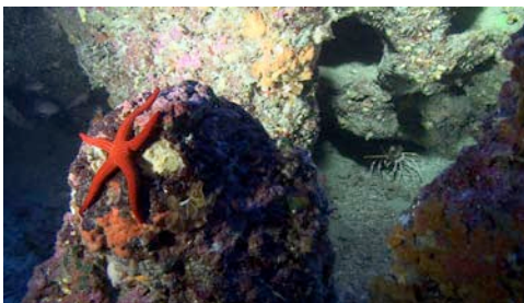
estrella de mar ( Hacelia attenuata )