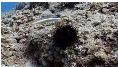
garota ( Arbacia lixula ) i peix