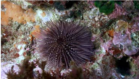
garota ( Paracentrotus lividus )