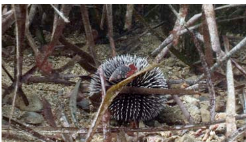
garota violeta ( Sphaerechinus granularis )