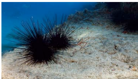
diadema ( Diadema antillarum )