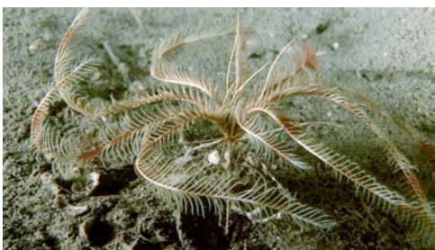
crinoïdeu ( Leptometra phalangium )