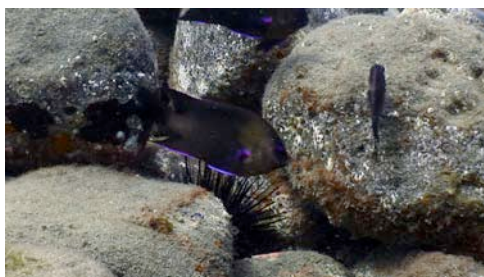
diadema ( Diadema antillarum ) i castanyola