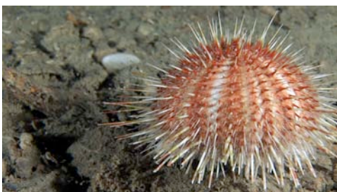
eriçó de fondària ( Echinus acutus )