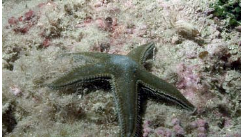
estrella de mar ( Astropecten sp.)