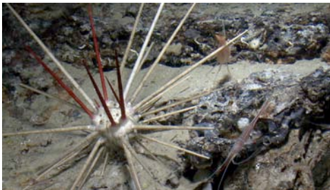
tabaquera ( Cidaris cidaris ) i gambes ( Plesionika narval )