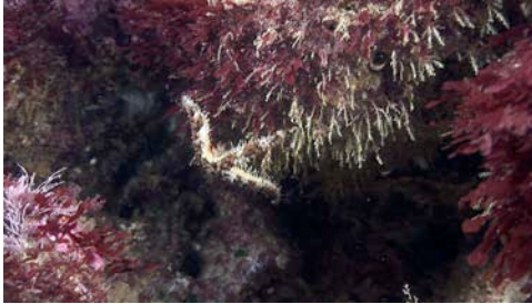
estrella de mar ( Coscinasterias tenuispina )