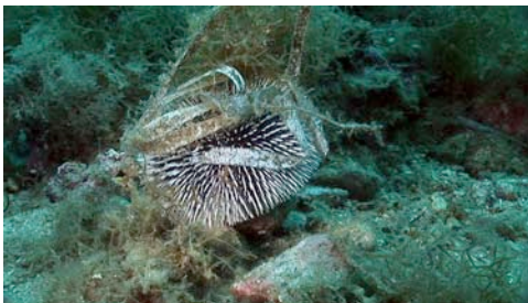
garota violeta ( Sphaerechinus granularis )