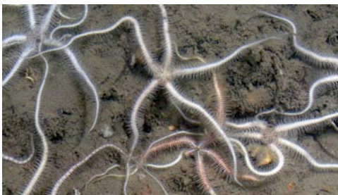
ofiuroïdeus ( Ophiothrix quinquemaculata )