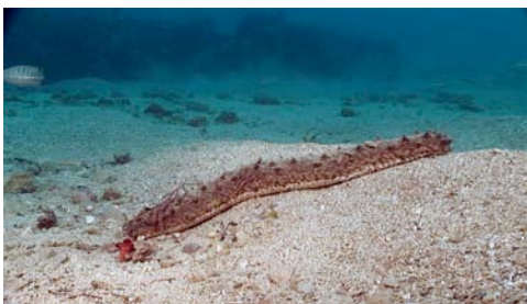
holotúria o cogombre de mar ( Holothuria sp.)