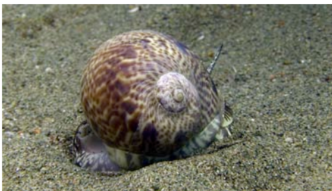
cargol de lluna ( Naticarius cruentatus )