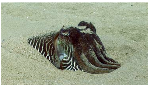
sèpia ( Sepia officinalis )