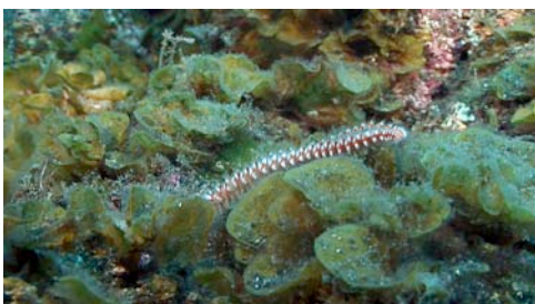
cuc de foc ( Hermodice carunculata )