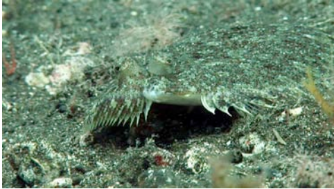
pedaç o tapaculs ( Bothus podas )