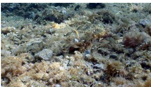
tamborer ( Symphodus cinereus )