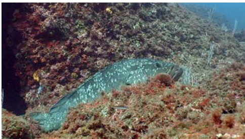
mero ( Epinephelus marginatus )