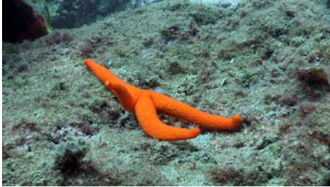
estrella roja ( Echinaster sepositus )