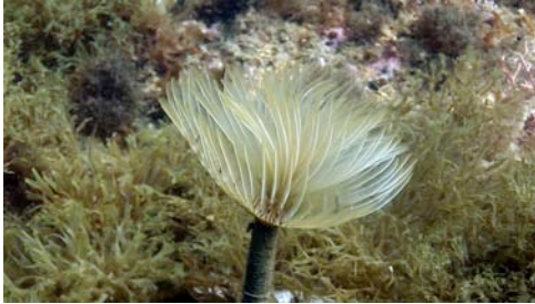
palmereta ( Spirographis spallanzani )