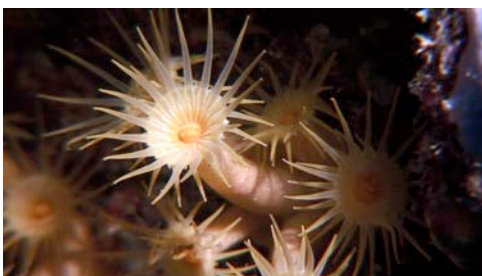
cnidari ( Parazoanthus axinellae )