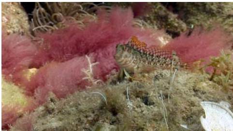
bavosa llangardaix o capsigrany ( Parablennius sanguinolentus ) i alga vermella