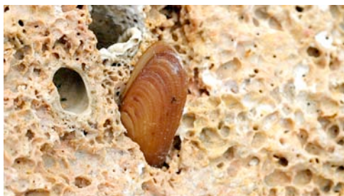
dàtil de mar ( Lithophaga lithophaga )