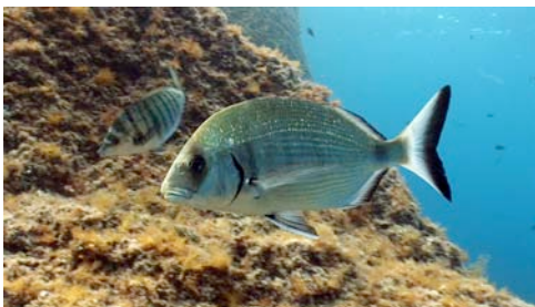
sarg ( Diplodus sargus )