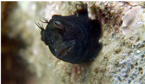
bavosa de plomall ( Parablennius pilicornis )