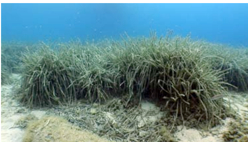
posidònia ( Posidonia oceanica )