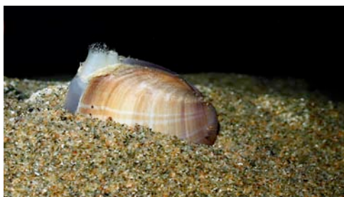
ou ( Mactra stultorum )