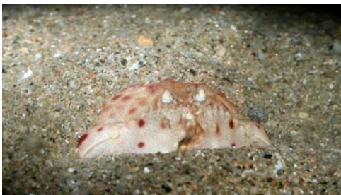
cranc rei ( Calappa granulata )