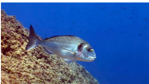
orada ( Sparus aurata )