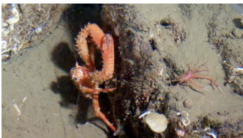
cranc de fondària ( Galathea strigosa )