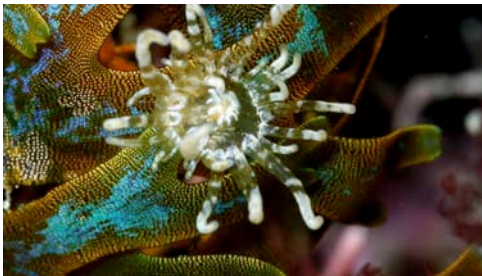
anemone de la posidònia ( Paranemonia cinerea )