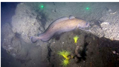
molla de roca o bròtola ( Phycis phicis )