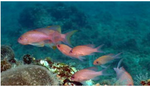
forcadella ( Anthias anthias )