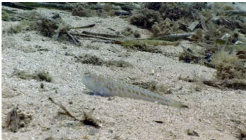
aranya de mar ( Trachinus draco )