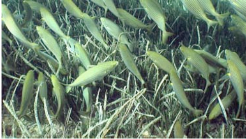
salpa ( Sarpa salpa )