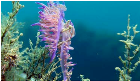
mol·lusc opistobranqui ( Flabellina affinis )