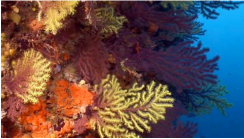
gorgònia roja ( Paramuricea clavata )