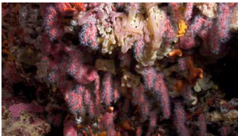
corall vermell ( Corallium rubrum )