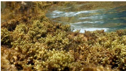
alga bruna ( Cystoseira compressa )

Atenció: no totes les espècies tenen noms comuns; algunes només reben el nom del grup dels organismes al qual pertanyen. D'altra banda, no facilitem el nom científic de totes les espècies perquè sovint, per precisar-lo, a part de la imatge calen més informacions.