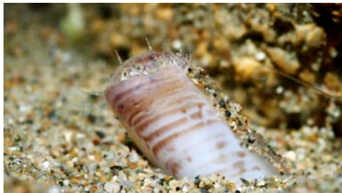
navalla ( Solen sp.)