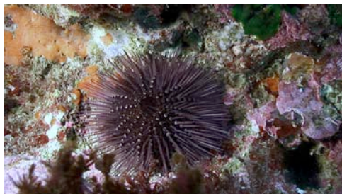
erizo de mar ( Paracentrotus lividus )