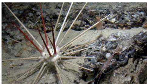
tabaquera ( Cidaris cidaris ) y gambas ( Plesionika narval )