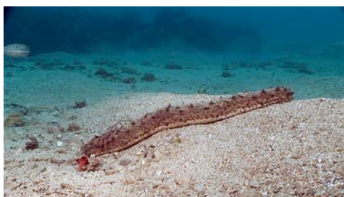
holoturia o pepino de mar ( Holothuria sp.)