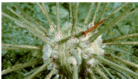
tabaquera ( Cidaris cidaris )