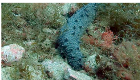
holoturia o pepino de mar ( Holothuria sp.)