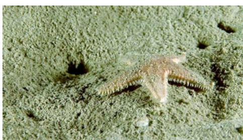
estrella de mar ( Astropecten sp.)