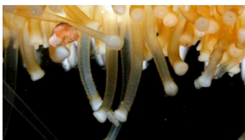
pies ambulacrales de una estrella de mar