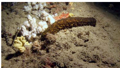
holoturia o pepino de mar ( Holothuria sp.)