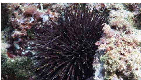
erizo de mar ( Paracentrotus lividus )

Atención: no todas las especies tienen nombres comunes; algunas reciben sencillamente el nombre del grupo de organismos al que pertenecen. No se proporciona el nombre científico de todas las especies porque, para determinarlo, se requiere más información aparte de imágenes.