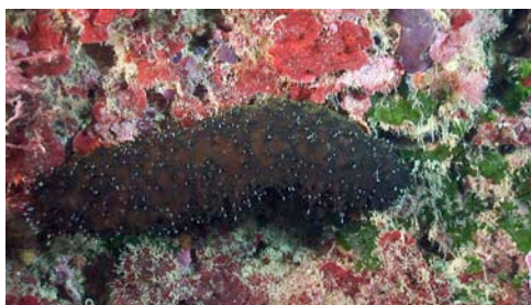
holoturia o pepino de mar ( Holothuria sp.)