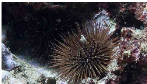
erizo de mar ( Paracentrotus lividus )