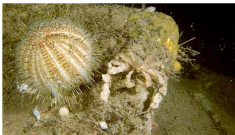
erizo de profundidad ( Echinus sp.) y cangrejo recubierto de esponjas ( Inachus thoracicus )