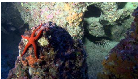
estrella de mar ( Hacelia attenuata )