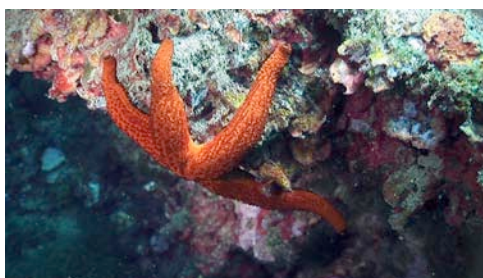
estrella espinosa ( Echinaster sepositus )