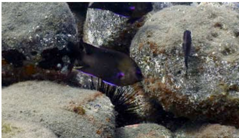
diadema ( Diadema antillarum ) y castañuela