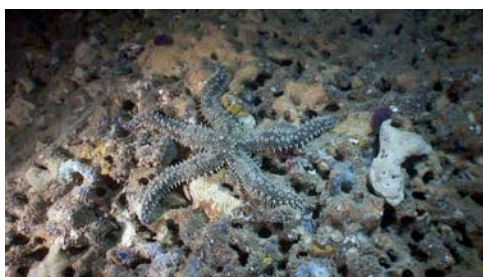
estrella de mar ( Marthasterias glacialis )