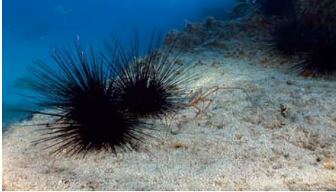
diadema ( Diadema antillarum )