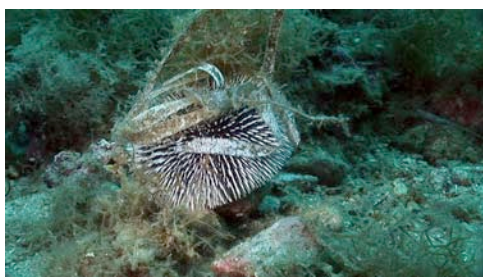
erizo violáceo ( Sphaerechinus granularis )