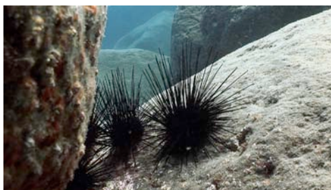
diadema ( Diadema antillarum )