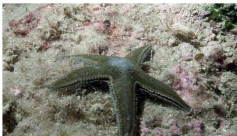
estrella de mar ( Astropecten sp.)