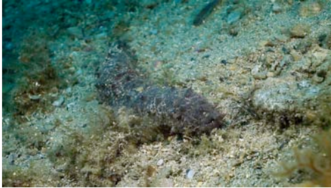
holoturia o pepino de mar