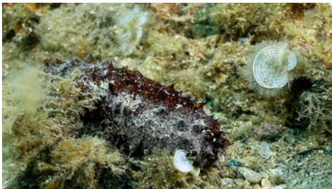
holoturia o pepino de mar ( Holothuria sp.)