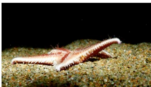
estrella de mar ( Astropecten sp.)