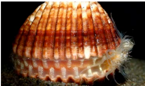
escopinya ( Acanthocardia tuberculata )