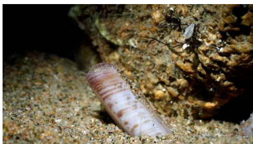
navalla ( Solen sp.)