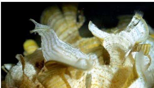
mol·lusc opistobranqui ( Phyllaplysia lafonti )