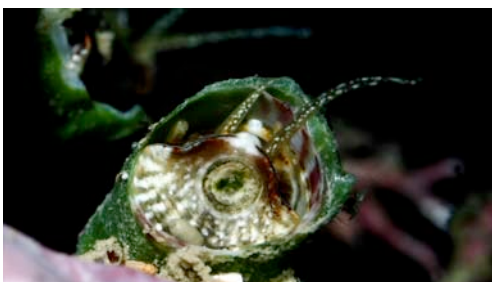
cargol cuc (mol·lusc gasteròpode)