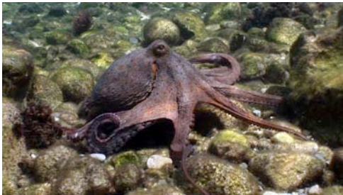
pop roquer ( Octopus vulgaris )

Atenció: no totes les espècies tenen noms comuns; algunes només reben el nom del grup dels organismes al qual pertanyen. D'altra banda, no facilitem el nom científic de totes les espècies perquè sovint, per precisar-lo, a part de la imatge calen més informacions.