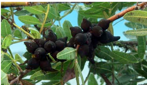
ous de sèpia ( Sepia officinalis )