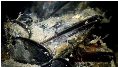
musclo ( Mytilus galloprovincialis )