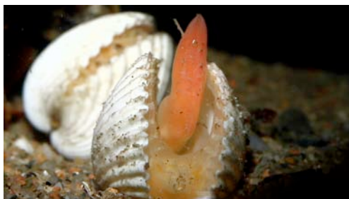
escopinya ( Acanthocardia spinosa )