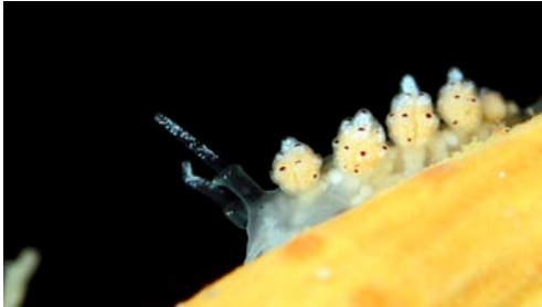
mol·lusc opistobranqui ( Doto cf koenneckeri )