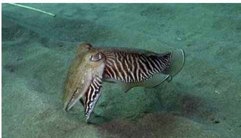
sèpia ( Sepia officinalis )