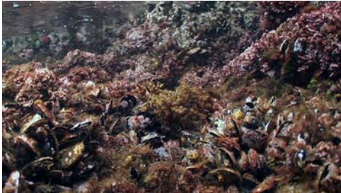
musclo ( Mytilus galloprovincialis )