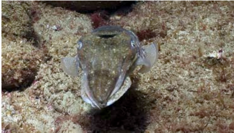
sèpia ( Sepia officinalis )