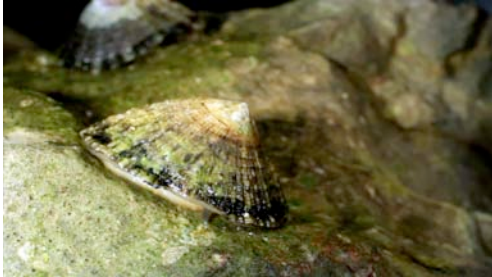
pagellida ( Patella rustica )