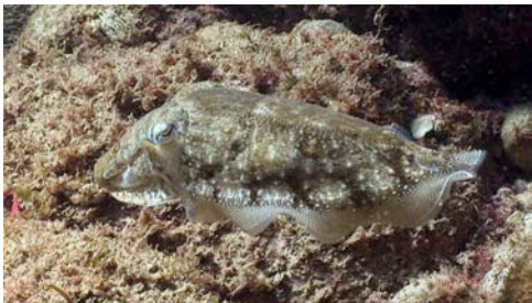
sèpia ( Sepia officinalis )