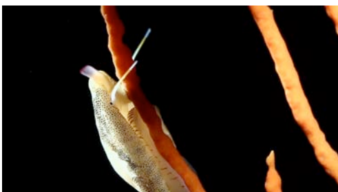
cipreid ( Cypraea sp.)