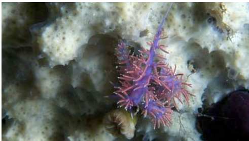
mol·lusc opistobranqui ( Flabellina ischitana )