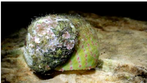
cargol ( Gibbula divaricata )