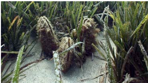
nacra ( Pinna nobilis )