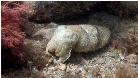
sèpia ( Sepia officinalis )