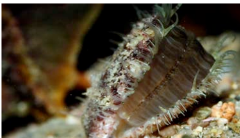
mol·lusc bivalve ( Chlamys sp.)