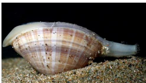
cloïssa ( Ruditapes sp.)