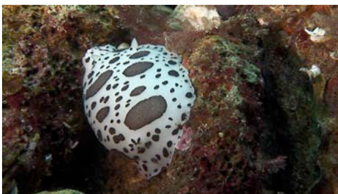
vaqueta suïssa ( Peltodoris atromaculata )