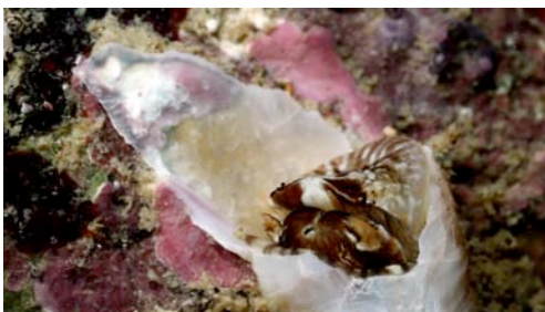
cargol cuc (mol·lusc gasteròpode)