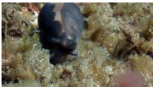
mol·lusc gasteròpode ( Luria lurida )