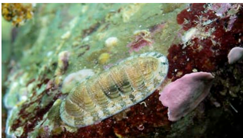
poliplacòfor ( Chiton olivaceus )