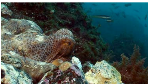
pop roquer ( Octopus vulgaris )