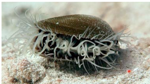
mol·lusc bivalve ( Lima sp.)