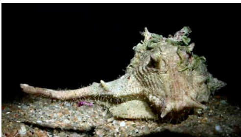
cargol de punxes o cargol punxenc ( Bolinus brandaris )