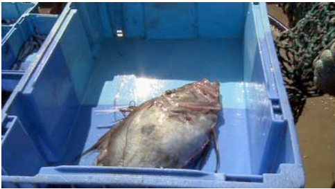
pez de san Pedro ( Zeus faber )