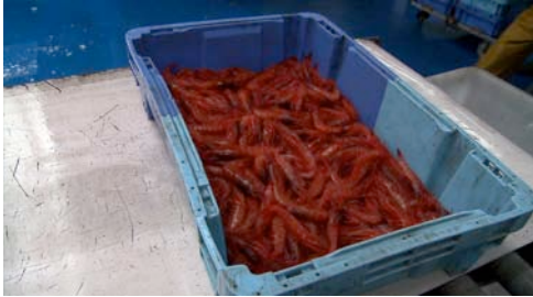
gamba ( Aristeus antennatus )