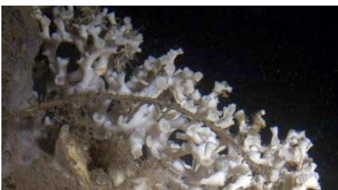
detalle de coral blanco ( Madrepora oculata ) con palangre