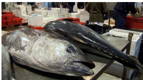
atún ( Thunnus sp. )

Atención: no todas las especies tienen nombres comunes; algunas reciben sencillamente el nombre del grupo de organismos al que pertenecen. No se proporciona el nombre científico de todas las especies porque, para determinarlo, se requiere más información aparte de imágenes.