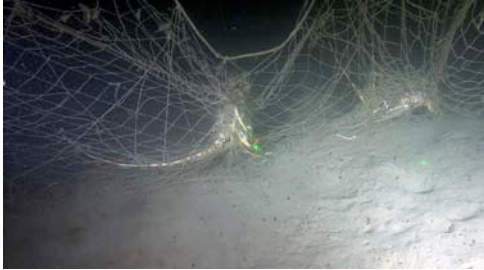
langosta ( Palinurus elephas ) atrapada en una red