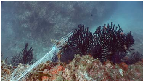
gorgonia roja ( Paramuricea clavata )