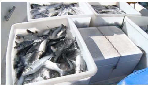
lubina ( Dicentrarchus labrax )