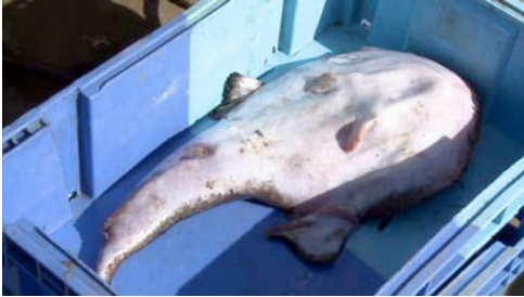
rape ( Lophius sp.)