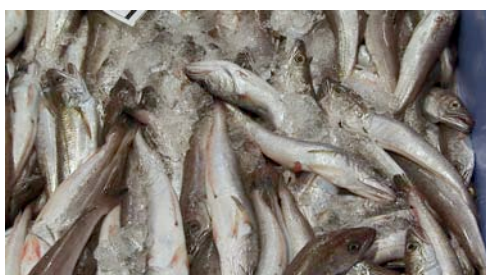
merluza ( Merluccius merluccius )