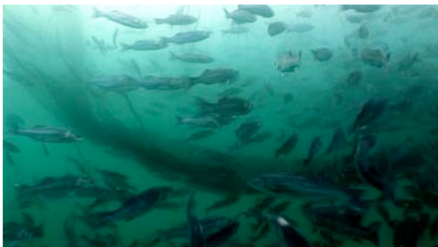
lubina ( Dicentrarchus labrax )