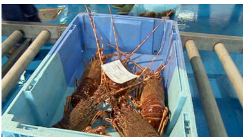
langosta ( Palinurus elephas )