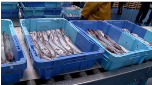
merluza ( Merluccius merluccius )