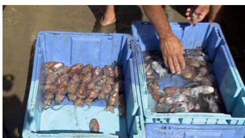
sepia ( Sepia officinalis )