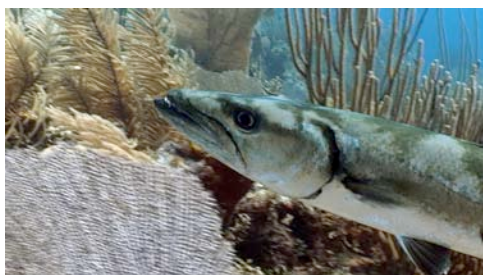
barracuda ( Sphyraena barracuda )