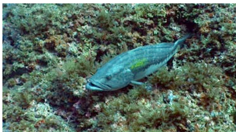
falso abadejo ( Epinephelus alexandrinus )