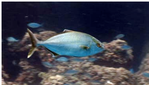
seriola ( Seriola dumerili )