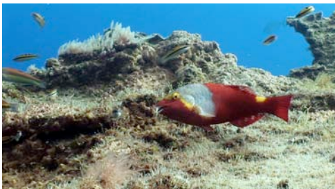
vieja ( Sparisoma cretense )