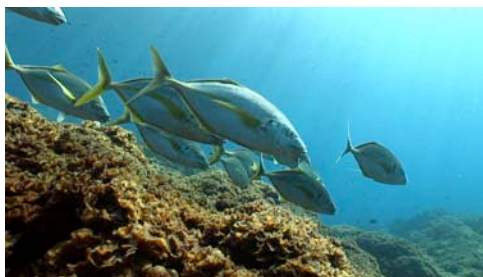
jurel dentón ( Pseudocaranx dentex )