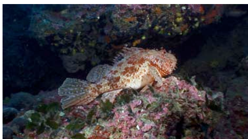
cabracho ( Scorpaena scrofa )