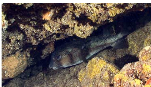
tamboril espinoso ( Chilomycterus atringa )