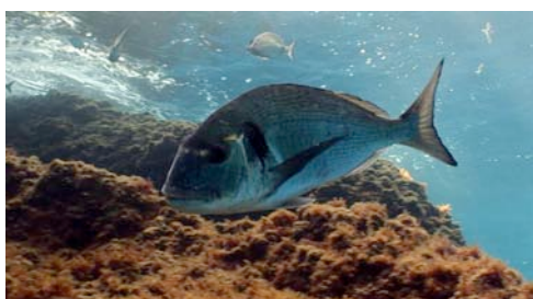
dorada ( Sparus aurata )