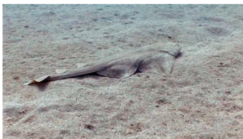
angelote ( Squatina squatina )