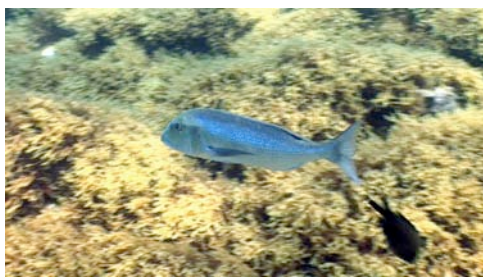
dentón ( Dentex dentex )