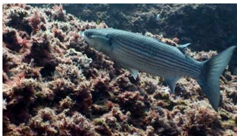
lisa dorada ( Liza aurata )