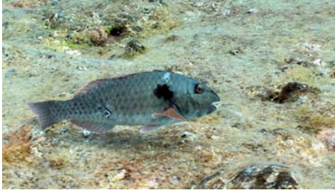
vieja ( Sparisoma cretense )