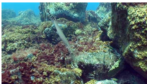
pez trompeta ( Aulostomus strigosus )