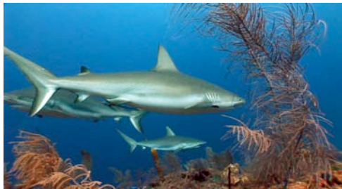
tiburón gris de arrecife ( Carcharhinus amblyrhynchos )