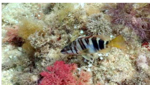
serrano ( Serranus scriba )