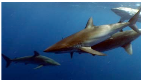
tiburón sedoso ( Carcharhinus falciformis )

Atención: no todas las especies tienen nombres comunes; algunas reciben sencillamente el nombre del grupo de organismos al que pertenecen. No se proporciona el nombre científico de todas las especies porque, para determinarlo, se requiere más información aparte de imágenes.