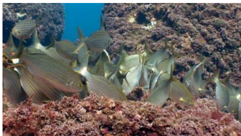
salpa ( Sarpa salpa )