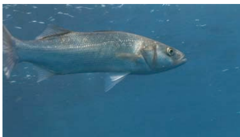
lubina ( Dicentrarchus labrax )