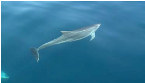
delfín listado ( Stenella coeruleoalba )