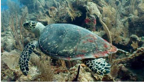
tortuga verde ( Chelonia mydas )