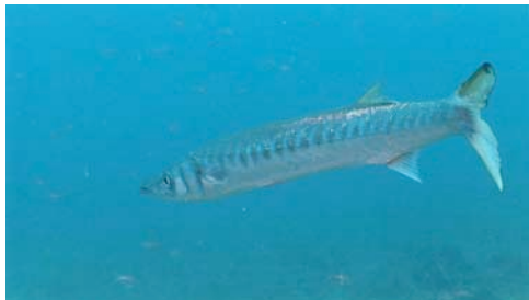
espetón ( Sphyraena sphyraena )