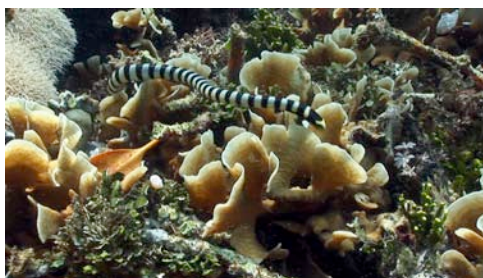
cobra marina ( Laticauda colubrina )