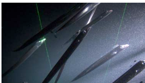
pez cinto ( Lepidopus caudatus )