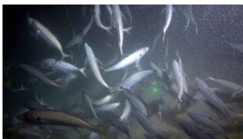
jurel ( Trachurus sp.)