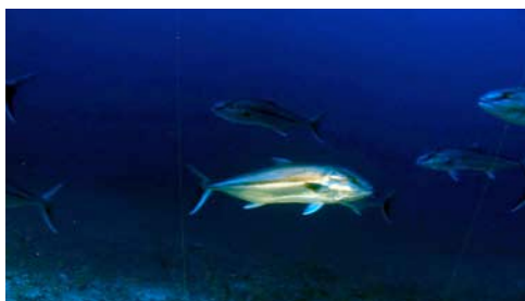
seriola ( Seriola dumerili )