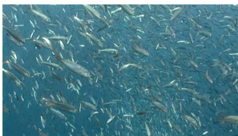
boquerón ( Engraulis encrasicolus )

Atención: no todas las especies tienen nombres comunes; algunas reciben sencillamente el nombre del grupo de organismos al que pertenecen. No se proporciona el nombre científico de todas las especies porque, para determinarlo, se requiere más información aparte de imágenes.