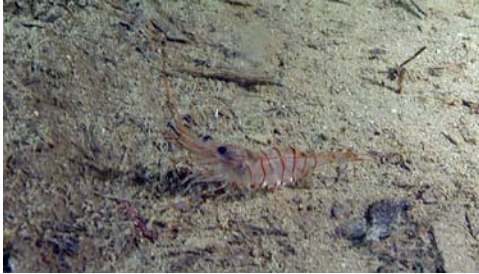
gamba de profundidad ( Palaemon serratus )