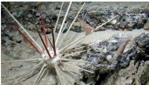
tabaquera ( Cidaris cidaris ) con gambas de profundidad ( Plesionika narval )