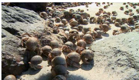
cangrejos ( Coenobita sp.)