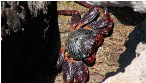
cangrejo ( Grapsus grapsus )