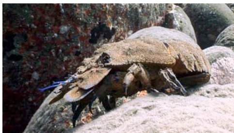
cigarrón ( Scyllarides latus )