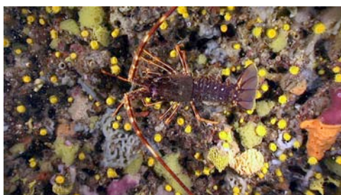
langosta ( Palinurus elephas )

Atención: no todas las especies tienen nombres comunes; algunas reciben sencillamente el nombre del grupo de organismos al que pertenecen. No se proporciona el nombre científico de todas las especies porque, para determinarlo, se requiere más información aparte de imágenes.