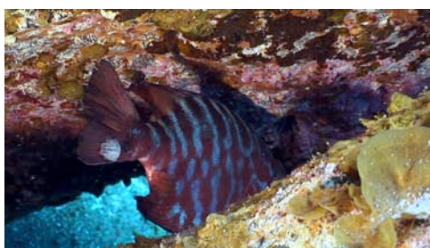
isópodo parásito de la catalufa ( Heteropriacanthus cruentatus )