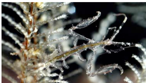
anfípodo caprélido sobre hidrozoo