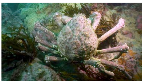
centolla ( Maja squinado )