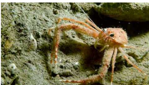
cangrejo de profundidad ( Munida rugosa )