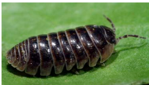
cochinilla o isópodo