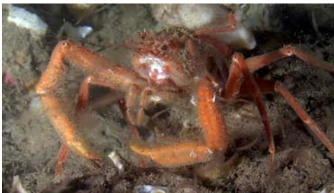
cangrejo ( Homola barbata )