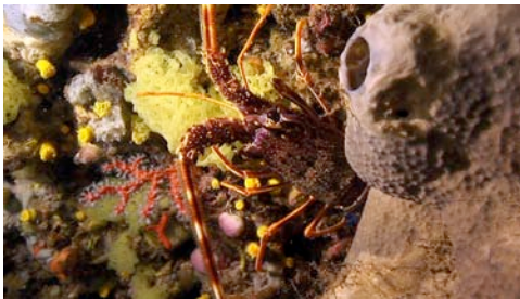
langosta ( Palinurus elephas )