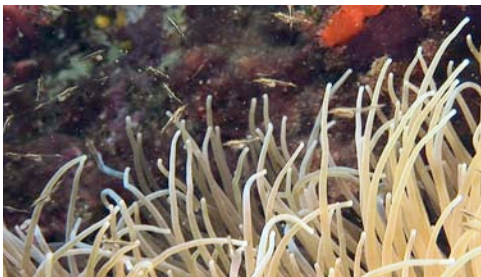
misidáceos entre los tentáculos de una anémona