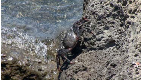
cangrejo ( Grapsus grapsus )