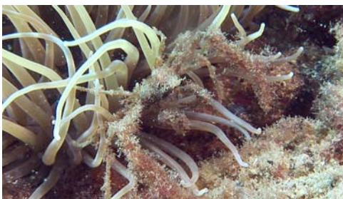
cangrejo ( Inachus phalangium )