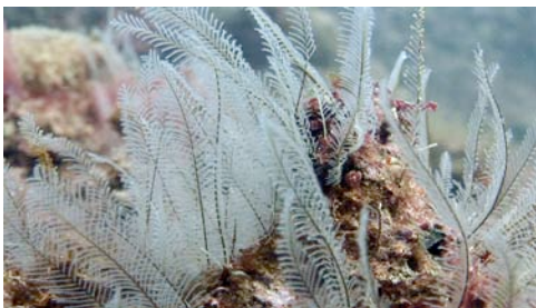
hidrozoo ( Aglaophenia sp.)