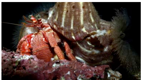
cangrejo ermitaño ( Dardanus arrosor )