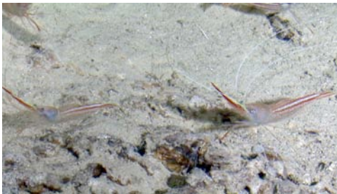
gambas de profundidad ( Plesionika narval )