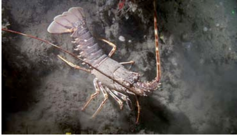
langosta ( Palinurus elephas )