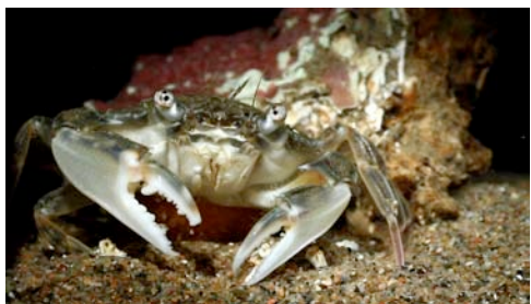
cangrejo ( Liocarcinus sp.)