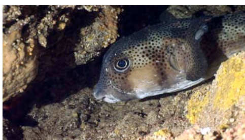
isópodo parásito del tamboril espinoso ( Chilomycterus atringa )