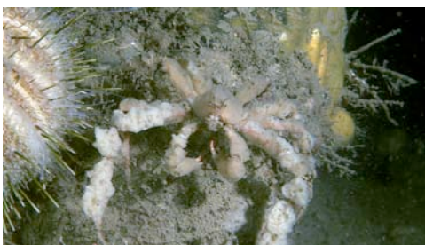
cangrejo recubierto de esponjas ( Inachus cf. thoracicus )