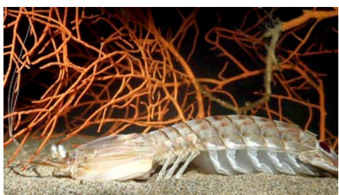
galera ( Squilla mantis )