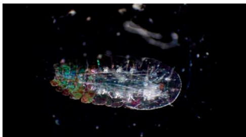
copépodo parásito ( Sapphirina sp.)